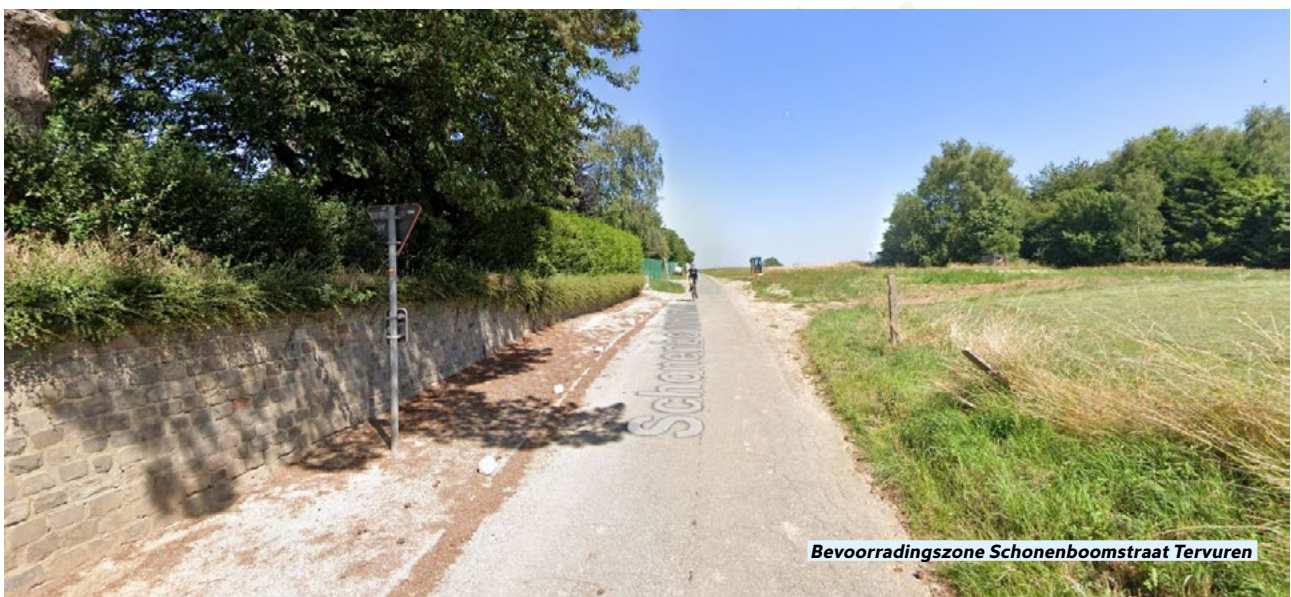
Bevoorradingzone Schonenboomstraat Tervuren