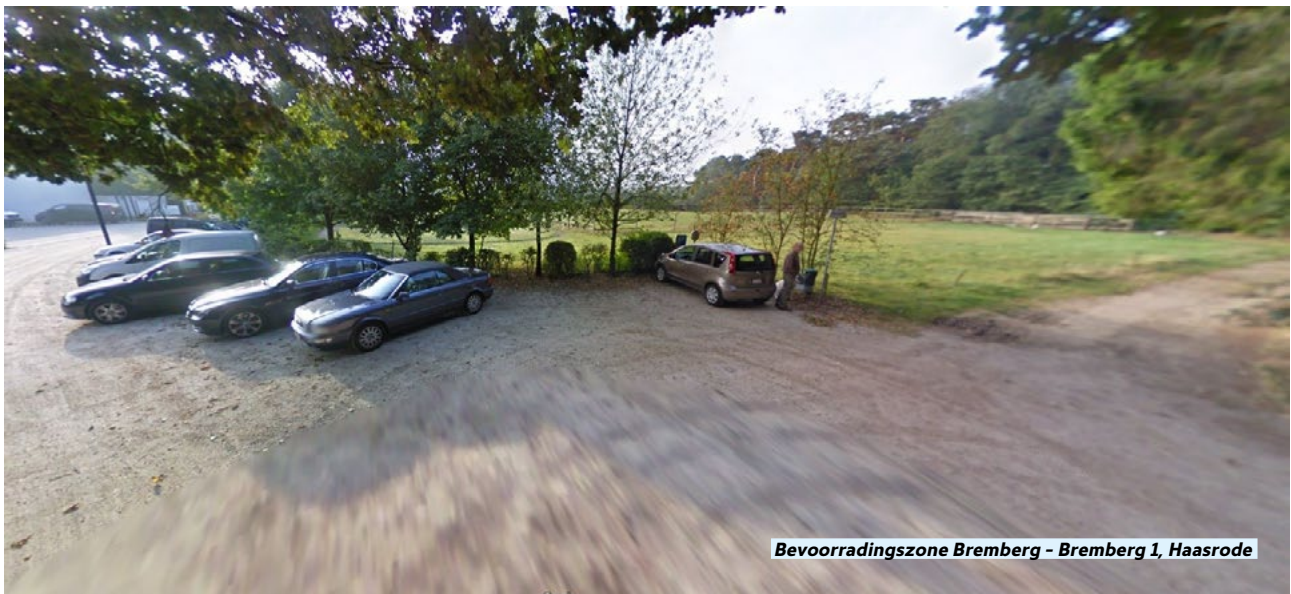
Bevoorradingzone Bremberg - Bremberg 1, Haasrode