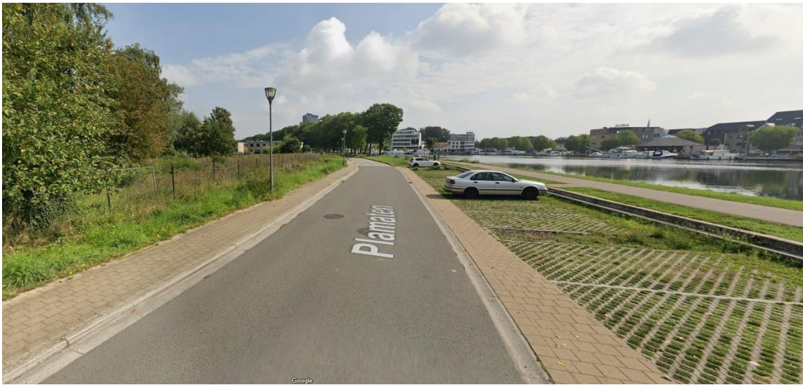
Zone de ravitaillement Plamaten (autre côté de l'arrivée)