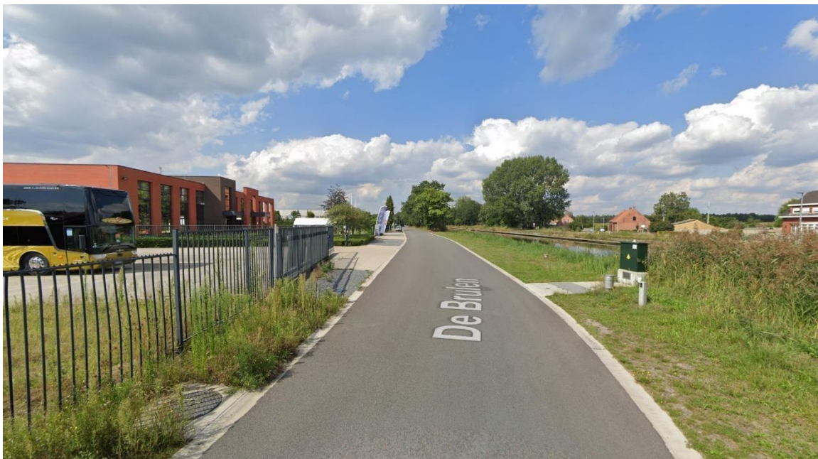
Zone de ravitaillement De Brulen – Arendonk